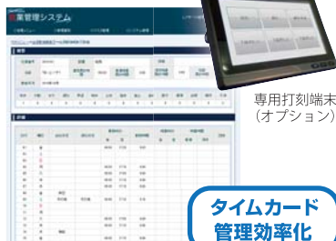
専用打刻端末 (オプション)

出勤退勤の記録を行う為のシステムです。拠点や打刻する場所が複数に分かれていても、効率よく集中管理が可能です。給与計算ソフトとの連動も可能です。