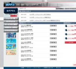
「ヨクデル」マイページ

業務の効率化やシステム化を「低コスト」で「スピーディー」に実現できるシステムで、データの保全性やシステム管理者の負担低減、年間運用コストの削減などといった数多くのメリットを提供することができます。業務改善から業績の向上をお考えの方におすすめています。